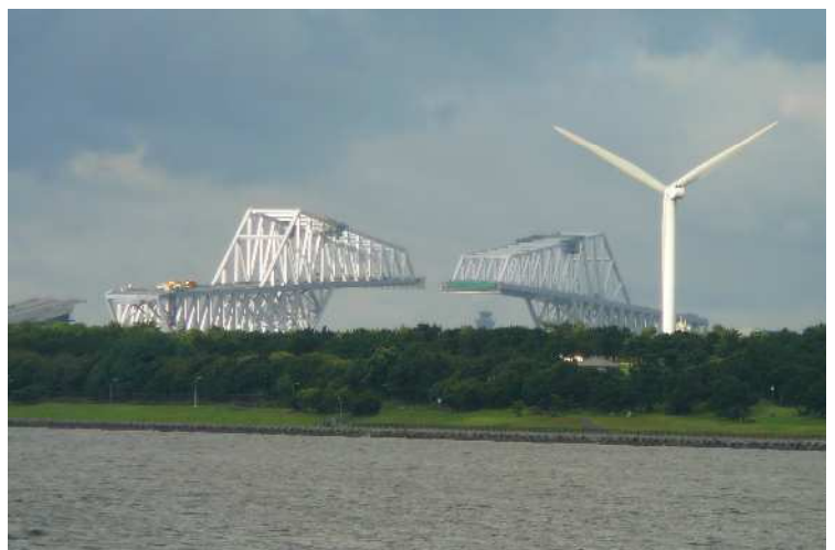
【写真;建設中の東京港臨海大橋(仮称)と若洲の風車】

しろがね 白銀の怪獣二匹いままさに 激突せんか若洲の森に 酷熱の日差しを避けてバス待てば 蝉の合唱いともかしまし 明け初めし夏の園生に拳舞えば て ろうきゅう 掌の勞宮に気の兆しくる 亜熱帯になったと言われるトウキョウに スコール 夕立来ぬやルアモイ恋し (ルアモイはヴェトナムの米焼酎のこと)